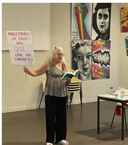
*une conférence gesticulée est un outil d'éducation populaire qui mélange savoirs froids et savoirs chauds

L'ensemble de ces retours sera ensuite mis en scène. Cette conférence collective sera amenée à être présentée devant différents publics lors des prochaines années.